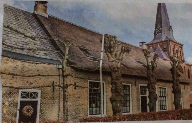
▲ Na de brand is het huis van de familie Haffmans volledig gerenoveerd.